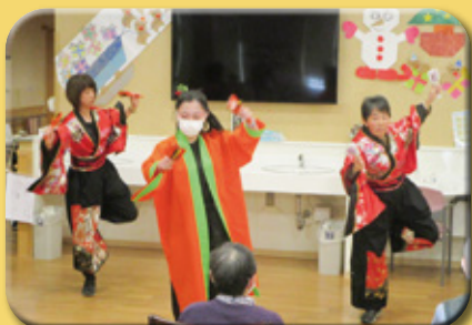
いしかわぐんよさこい踊り隊