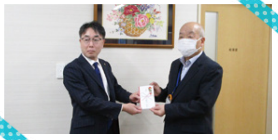
石川ライオンズクラブ